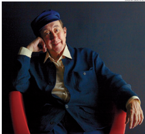
>>> Mite >>> El cantant argentí, en una imatge d'arxiu del 2003.

–¿Què té Luis Aguilé a veure amb el món de l'havanera?